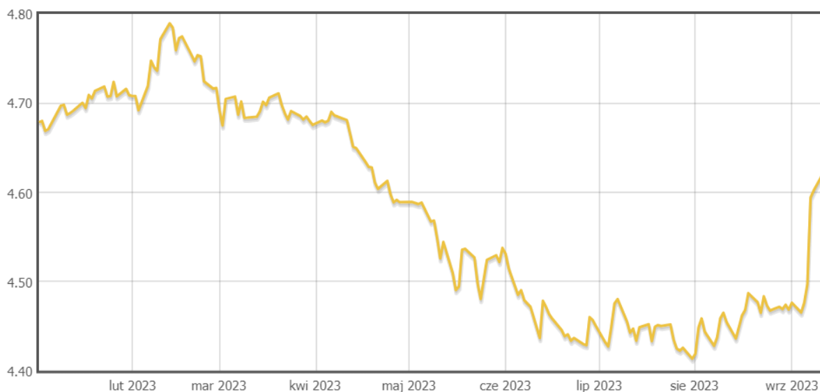
Wykres kursu EUR w stosunku do PLN w okresie od 01.01.2023 – 29.09.2023 (kursy średnie NBP)

Źródło: http://www.finanse.egospodarka.pl