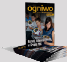
Biuletyn Korporacyjny „Ogniwo”

były w nakładzie ok. 100 egzemplarzy. Dziś Biuletyn Korporacyjny „Ogniwo” liczy ok. 60 stron i trafia do blisko 1500 czytelników. Od samego początku gazeta, niezależnie od formy i objętości, tworzona była przez Pracowników Grupy. Nasze „Ogniwo” zostało zauważone i nagrodzone tytułem „Internale 2011” w kategorii najlepszy projekt komunikacji wewnętrznej.