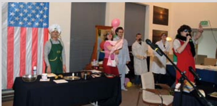
Angielski po Polsku, 2008

W roku 2007 założyliśmy Szkołę Języków Obcych PBG, szkolącą 30 uczniów. Dziś w Akademii Języków