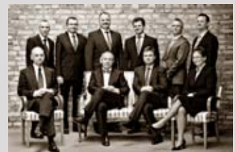
Zarząd PBG SA