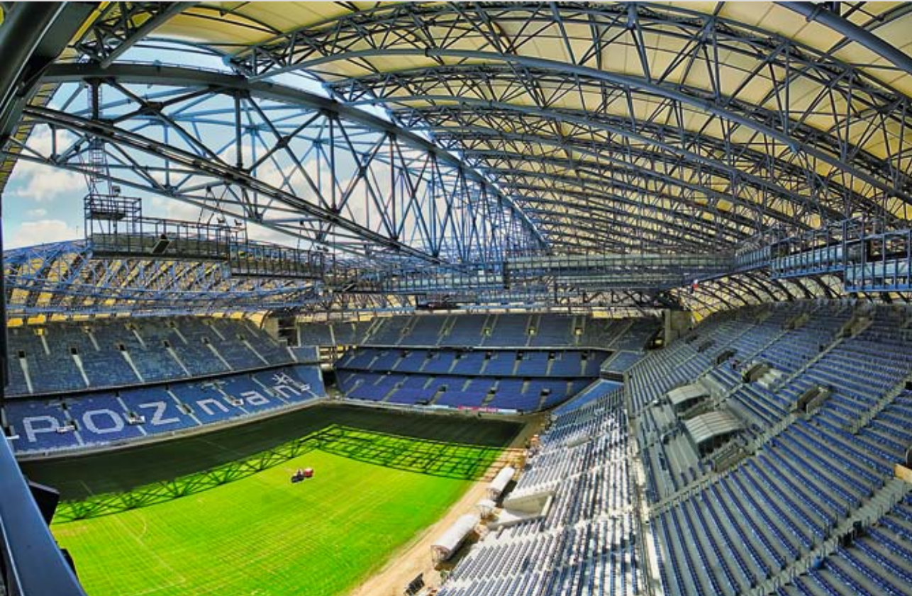
Stadion Miejski w Poznaniu okiem artysty

projektami. Każdego dnia w swojej pracy wykorzystują zdobytą wiedzę i umiejętności w procesach zarządzania realizowanymi inwestycjami.