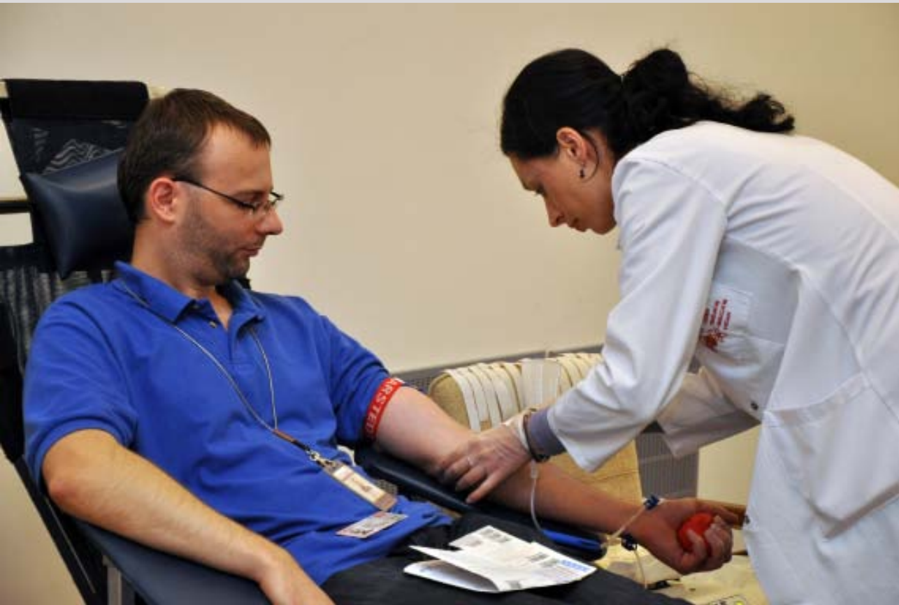
Nasze życie, nasze zdrowie – Akcja Krew

rew, na wniosek Fundacji, Centrum Krwiodawstwa przekaze ją potrzebującemu.