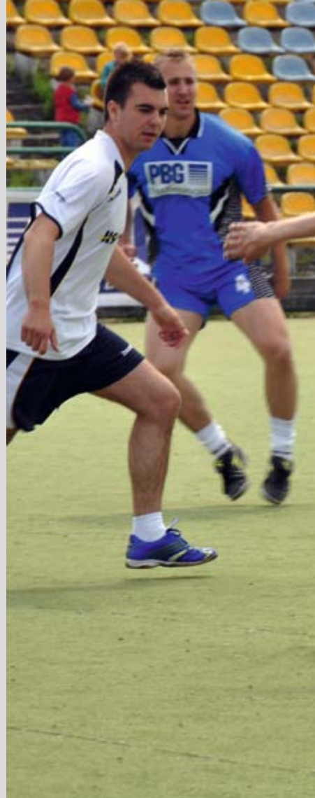
II Finał Ligi Piłkarskiej Grupy PBG

Od kilku lat miłośnicy sportów wodnych mają możliwość wspólnie pożeglować pod banderą „PBG Sailing Club”. Klub dla swoich członków, pracowników-żeglarzy (ok. 40-50 osób) w każdym sezonie organizuje regaty. Zwykle odbywają się one na Jeziorze Kierskim, Mazurach, zalewie koło Włocławka czy w Chorwacji. Do dyspozycji wszystkich żeglarzy GK PBG mamy 2 jachty kabinowe typu LUPUS, zacumowane na Mazurach. Poza tym pracownicy Grupy mogą nieodpłatnie korzystać z 15 żaglówek Harcerskiego Klubu Żeglarskiego w Kiekrzu. Ideą utworzenia Klubu było szerzenie i dzielenie ciekawej pasji oraz integracja na jachtach.