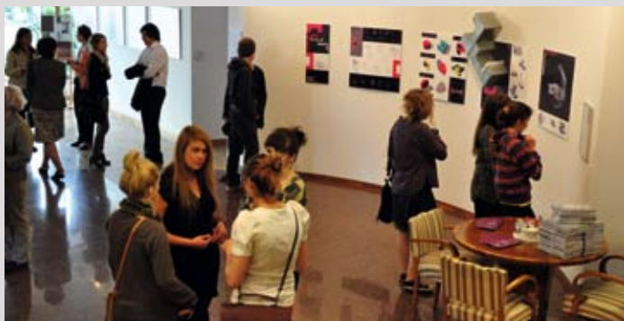
Wystawa młodych artystów z Liceum Plastycznego w Poznaniu

Poza organizacją wystaw i wernisaży artystów znanych i mniej znanych, PBG Gallery wspiera lokalny rynek sztuki. Współpracuje z poznańskim Uniwersytetem Artystycznym, Liceum Plastycznym