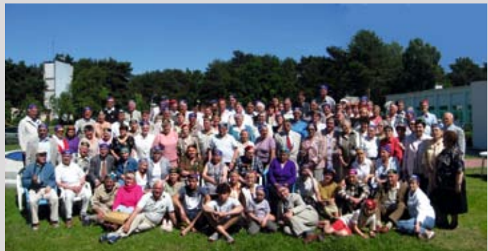
Uczestnicy Marszu Pamięci

warzyszenie Współpracy ze Wschodem MEMORAMUS, a uczestnikami uczniowie z polskich i rosyjskich szkół. Projekt realizowany jest dwuetapowo. Pierwszy z nich to prowadzenie międzyszkolnych zajęć z zakresu stosunków polsko-rosyjskich, drugi to organizacja wyjazdu młodzieży Smoleńsk-Katyń.