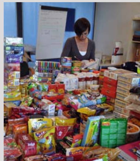
Zbiórka żywności dla potrzebujących rodzin

Staramy się także pomagać tym, którzy w danej chwili tego najbardziej potrzebują. Przykłady tego typu działań podjętych w ramach wolontariatu pracowniczego, to m.in. pomoc powodzianom w 2010 r., wsparcie dla schroniska dla zwierząt w Grodzisku czy udział w akcji „Ołówek dla Afryki”.