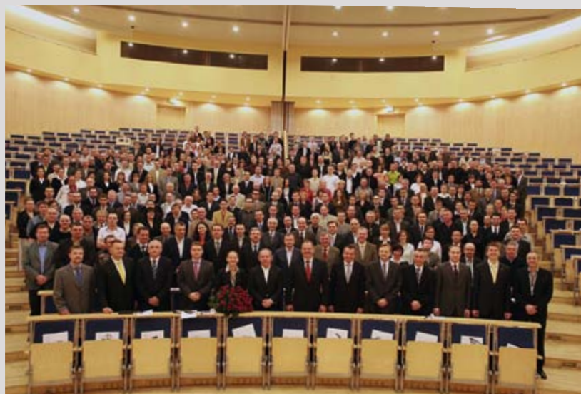
Spotkanie Informacyjno-Szkoleniowe 2009

też wspieramy ich i dajemy wszystkim równe szanse pogłębiania zainteresowań w różnego