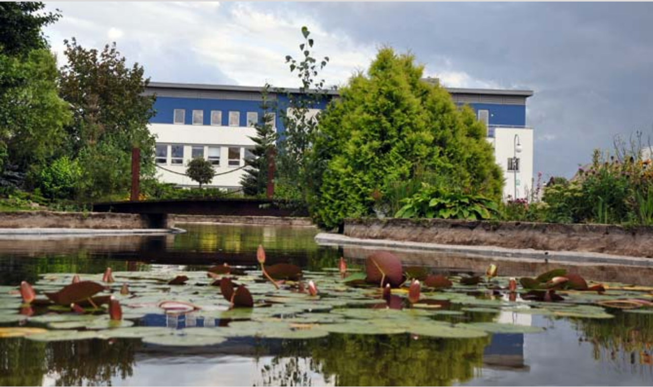
Oczko wodne przy siedzibie firmy PBG w Wysogotowie

piętaość skrzydeł nawet 2,5 m. Współpraca z KOO będzie kontynuowana, gdyż doskonale wpisuje się w naszą strategię zrównoważonego rozwoju. Chcemy bowiem dbać o środowisko naturalne i pozostawiać je dla przyszłych pokoleń w jak najmniej zmienionej formie.