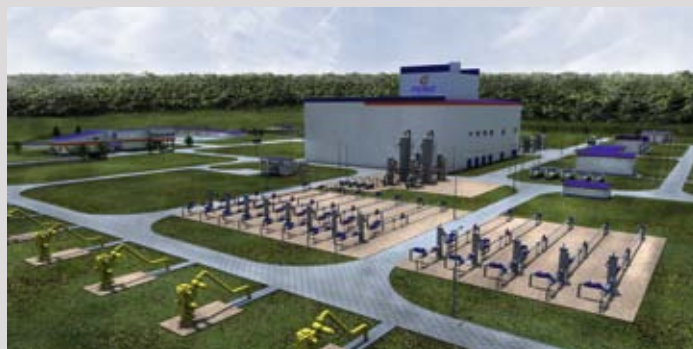
Podziemny Magazyn Gazu w Wierchowicach, projekt 3D